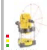
Tip LAX 100 Nokta işlevli ve sağ açılı otomatik tesviyeli çapraz çizgi lazeri