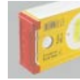
Kaymayı önleyici patentli uç kapaklar: Sadece tek elle dayamada dahi sağlam durur. Rahat bir şekilde işaretleme. Daha fazla emniyet.