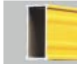
Güçlü dikdörtgen profil Takviye ve daha iyi kullanım için yivler