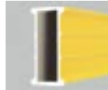
Ekstra sert dikdörtgen profil Takviye ve daha iyi kullanım için yivler 96/196