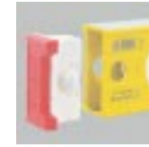
Çıkarılabilen kapaklar: Köşeye kadar işaretlemek – Dar kenarlara dayamak için.