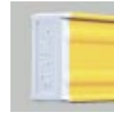
Standart kapaklar: Çarpmaya ve darbeye dayanıklı.

Darbelerin daha iyi emilmesi için, su terazisinin boş profili içerisindeki mesafe yeterli olmak zorundadır. STABILA bunun dışında pratik ilave fonksiyonlara sahip uç kapaklar sunmaktadır.