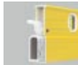
106 T Profil